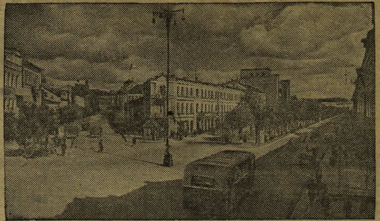
Центральная часть города Каунас. Направо — проспект имени Сталина.